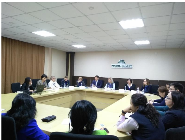
Фото 1. ВЭК проводит собеседование с сотрудниками РЦРЗ

стратегия, направления деятельности, организационная структура, управление, результаты, перспективы, распределение бюджета и ресурсов на непрерывное профессиональное развитие, статистика по дополнительному образованию, стратегическое планирование, НПА, которыми руководствуется в своей деятельности РЦРЗ). Экспертами заданы вопросы о политике привлечения к преподаванию сотрудников центра, стратегии и тактике набора слушателей на программы повышения квалификации, мотивационных подходах к набору слушателей, информационной обеспеченности, проблемах в области управления человеческими ресурсами и в реализации образовательных программ. Изучены материалы по приему слушателей и отбору преподавателей. Это интервью и изучение документации позволили экспертам валидировать данные отчёта по самооценке по стандарту 2,4,5.