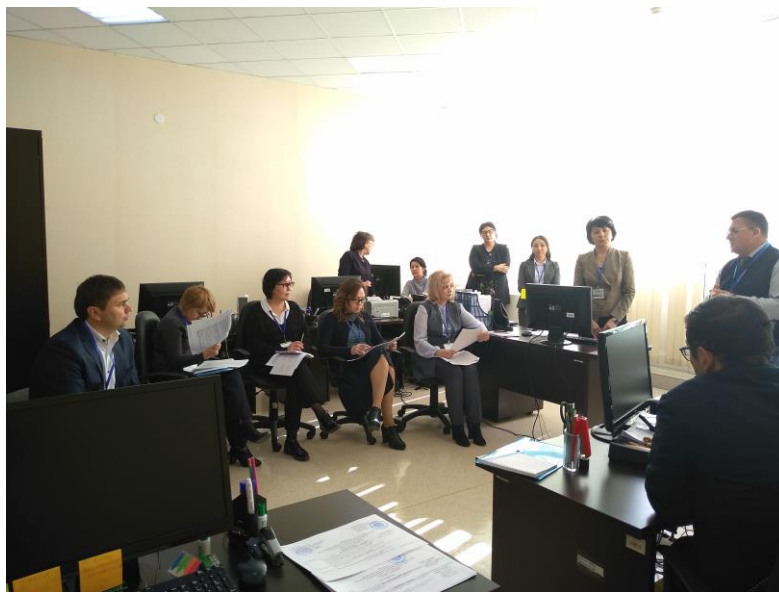
Фото 2. Визит ВЭК в центры РЦРЗ

Боранбаевны. Тема «Выбор дизайна исследований для прикладного бакалавриата» для преподавателей колледжа. Присутствовало 11 человек. Эксперты убедились в наличии методического обеспечения занятия (тематический план 2-х дневного тренинга, дидактический материал, доступ к компьютеров и международной базе PubMed), о соответствии структуры занятия ожиданиям слушателей, обнаружили активность слушателей и проведение оценки входного уровня знаний слушателей. Наблюдателем ЕЦА проведено анкетирование присутствовавших преподавателей колледжа. Таким образом, получены доказательства выполнения Стандартов 2,5,6.