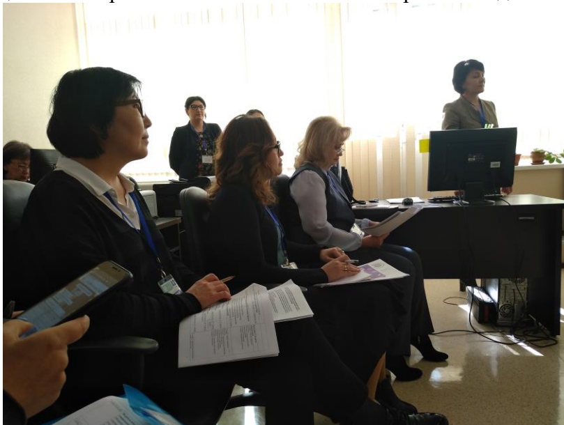
Фото 3. Изучение документации РЦРЗ

С помощью анкеты был оценен уровень подготовки слушателей до начала курсов повышения квалификации. Так, 90% считают, что слушатели, которые посещают занятия, имеют достаточный уровень подготовки, так изначально на обучение проводится отбор слушателей по уровню предшествующей подготовки, статуса в организации (руководители, ТОП-менеджеры, сотрудники вузов и т.д.). При этом коррелируя результаты вопроса об ожидаемых результатах по завершению курса, можно говорить об эффективности курсов и других мероприятий (мастер-классы, тренинги, круглые столы и др.), реализуемых в РЦРЗ. 93% уверены, что слушатели после завершения программы обучения обладают высоким уровнем знаний и практических навыков. Все преподаватели (100%), участвовавшие в анкетировании, полностью согласны с тем, что данное анкетирование является полезным для разработки рекомендаций по совершенствованию ключевых направлений деятельности РЦРЗ.