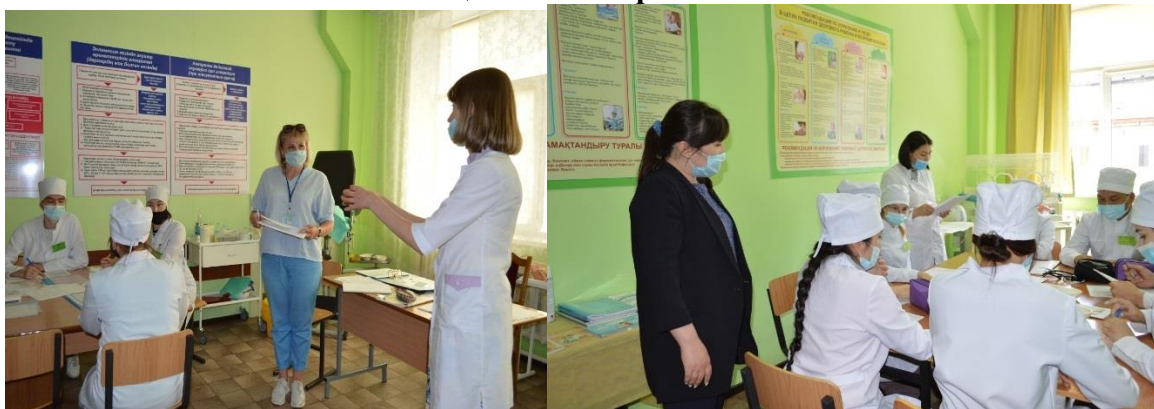
Фото 8. Посещение ВЭК практических занятий.