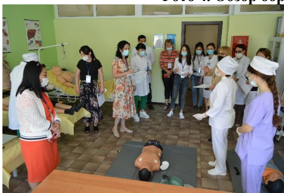
Фото 4. Обзор образовательных ресурсов.

Для обеспечения комфортного и современного образовательного процесса обучающимся доступны, пять компьютерных класса, где они могут использовать современные средства обработки информации, а также имеют доступ к широкополосному интернету. В учебном процессе используется 122 компьютера. Количество обучающихся на один компьютер составляет 7 человек. Преподавателям установлено 36 компьютеров с офисной печатной техникой. Для использования современных образовательных технологий, в колледже установлено 14 интерактивных досок с проекторами. Процент оснащенности кабинетов доклинической практики по всем специальностям составляет 85 %.