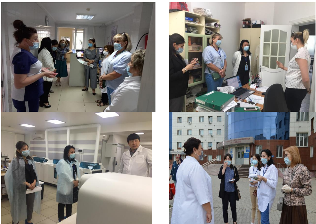
Фото 7. Посещение ВЭК клинических баз.

Согласно программе членам ВЭК продемонстрировали информационно-образовательную платформу Сова, используемую для дистанционного обучения: электронный журнал, расписание, ведомости, списки групп и прочее.